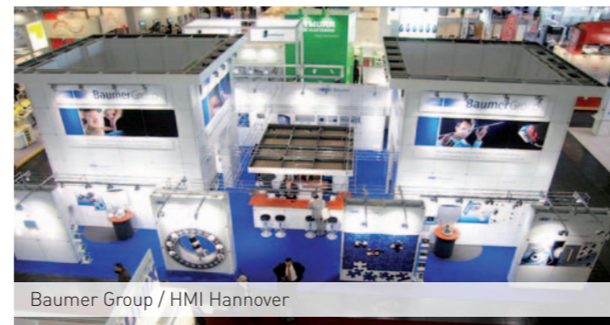
Baumer Group / HMI Hannover