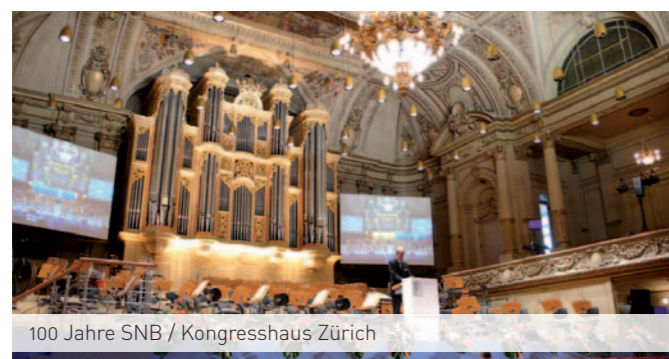
100 Jahre SNB / Kongresshaus Zürich