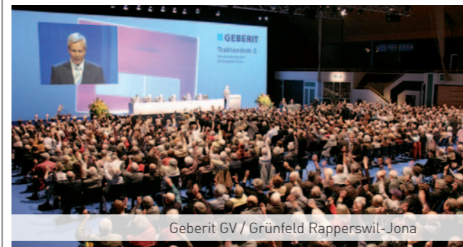
Geberit GV / Grünfeld Rapperswil-Jona

Alcon LLB Bank Linth Emmi Luzerner Kantonalbank NZZ OC Oerlikon Sonova Swiss Life Uster Technologies Valora Converium und weitere