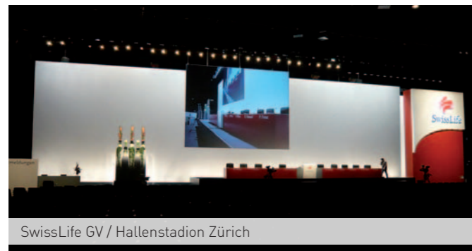
SwissLife GV / Hallenstadion Zürich