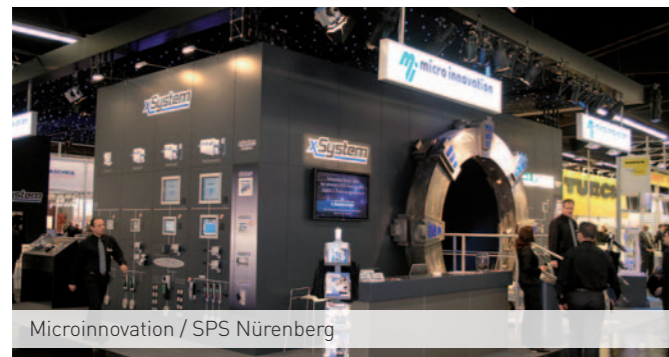
Microinnovation / SPS Nürnberg