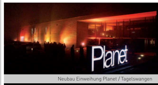
Neubau Einweihung Planet / Tagelswangen

Baumer Electric Clariden Bank Leu CSI Zürich Eternit Niederurnen Eternit Payern Kantonspolizei Zürich Phonak Planet GDZ Schweizerische Nationalbank Stadt Uster Sun Microsystems Public Viewing Euro 08 und weitere