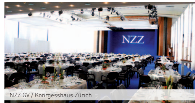
NZZ GV / Kongresshaus Zürich