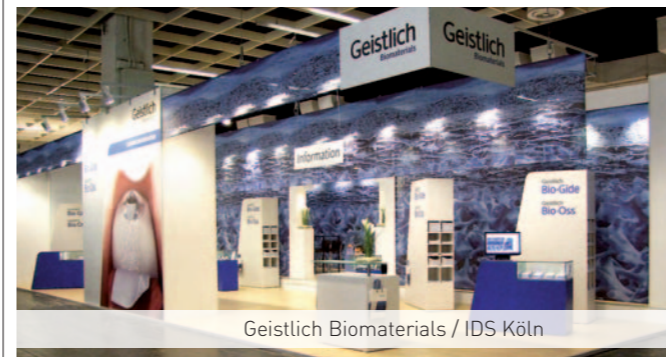
Geistlich Biomaterials / IDS Köln

ABB LTD. Baumer Group Credit Suisse Daimler Chrysler Feag Geistlich Biomaterials Micro Innovation Moeller Olympus Otto Fischer Rockwell und weitere